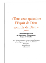
Orientations pastorales de Mgr Aumonier, évêque de Versailles, pour l'accompagnement aux sacrements d'initiation et leur déploiement dans la vie chrétienne des enfants, des adolescents et des adultes.