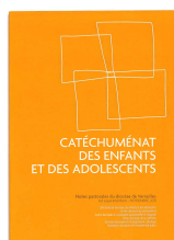
Notes pastorales du diocèse de Versailles, catéchuménat des enfants et des adolescents