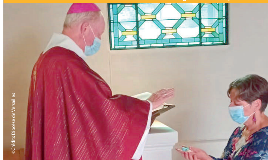
Chapelle de l'hôpital de Houdan, bénédiction et envoi en mission

La lettre d'information des donateurs de l'Église catholique en Yvelines