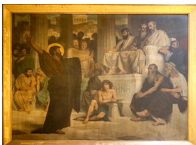
Saint Paul prêchant devant l'aréopage d'Athènes,

Saint Paul encourage à adopter, comme remède, une posture où c'est la Parole et la vie du Christ proclamée et vécue qui alimentent la vie chrétienne.