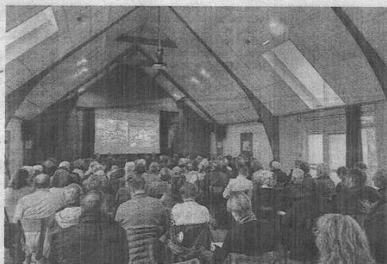
Beaucoup de monde à Poigny-la-Forêt, samedi matin, pour évoquer l'avenir des églises rurales, âmes des villages.

A court terme, la création d'un guide commun autour des églises rurales afin d'harmoniser les pratiques et de donner des éléments juridiques concrets. « Il y a nécessité d'inscrire dans le temps un mode de fonctionnement qui ne soit pas soumis aux changements de